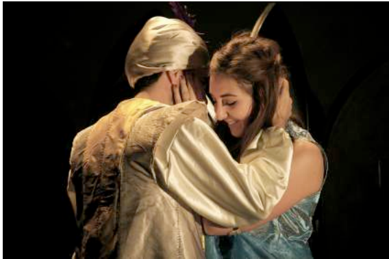
Aladin et Jasmine

Pour obtenir une lampe qui lui donnera tous les pouvoirs, un magicien doit trouver un jeune garçon qui se chargera de descendre dans une caverne, pour la prendre et la lui donner. Se faisant passer pour l'oncle d'Aladin, c'est ce dernier qu'il choisit.