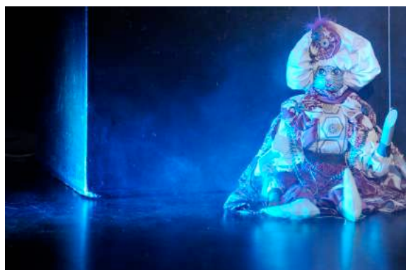
Le Génie de l'anneau

Aussi, afin de les aider à découvrir une version différente , avec des personnages inconnus dans la version de Disney , tels que, le Génie de l'anneau ou la mère d'Aladin, nous souhaitons garder certains noms des personnages Disney afin qu'ils puissent mieux se repérer .