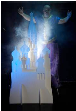
Le Génie de la lampe

Aladin et la lampe merveilleuse est une histoire riche en couleurs et en aventures , de toutes sortes, propices à une adaptation théâtrale.