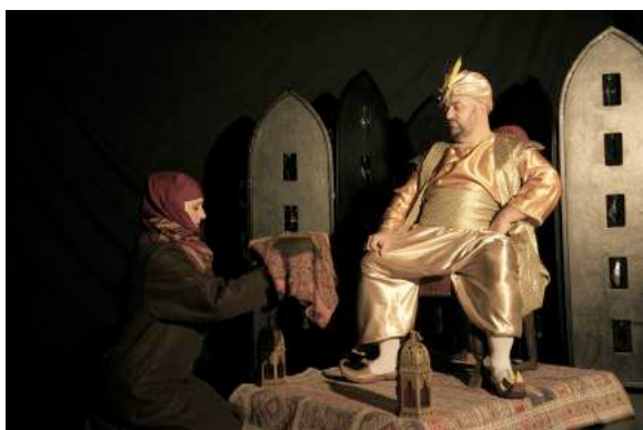
Le Sultan et la mère d'Aladin

L'anneau et la lampe merveilleuse, objets magiques , symbolisent la mise en pratique de la morale : les génies qui leur sont attachés sont au service de celui qui les possède. L' efficacité bénéfique ou maléfique de ces objets est tributaire du personnage qui les détient . Entre les mains du magicien , la lampe merveilleuse sert l' idée d'un pouvoir sans bornes ; aux mains d' Aladin , elle apporte au héros la possibilité d'accomplir le destin dont il rêve .