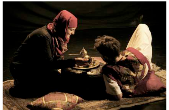
Aladin et sa mère

Comme dans la plupart des contes merveilleux, ce passage de l'enfance à l'âge adulte est d'ailleurs marqué par l'entrée dans un monde différent , dépeint comme le monde des morts et des puissances surnaturelles . Ici, la descente dans la caverne , dont il ressortira transformé.